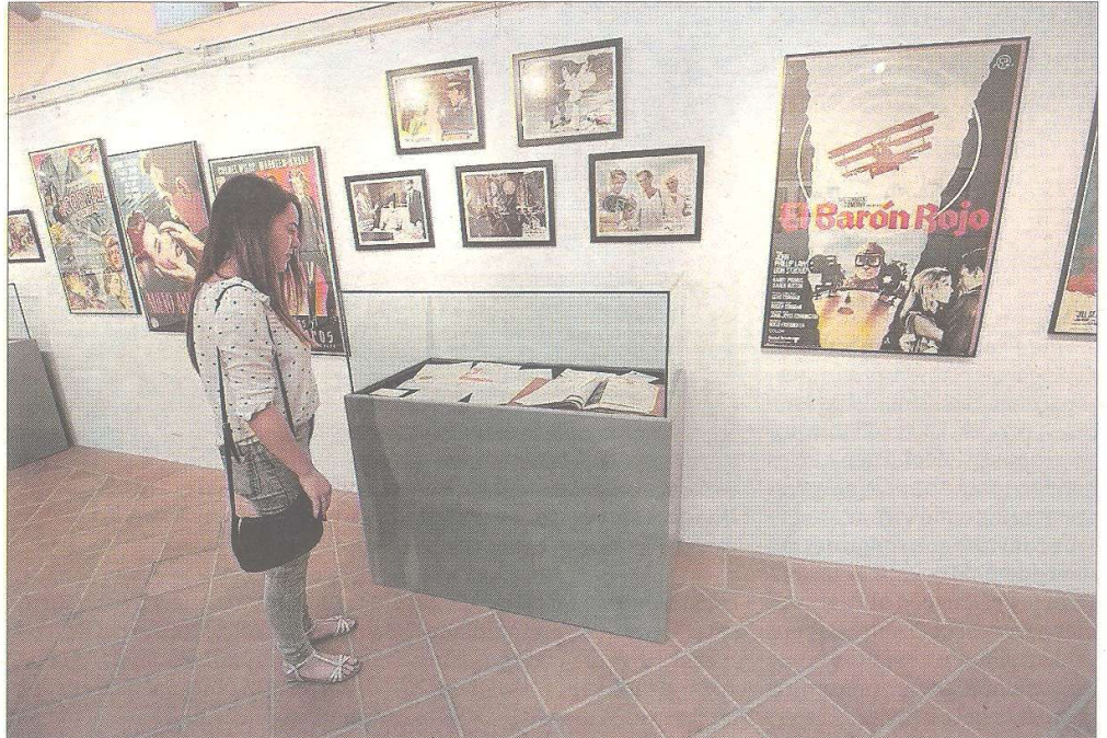
L'Arxiu Històric Comarcal del Baix Ebre acull l'exposició 'El cine Fèmina'.

Films espanyols, italians i nord-americans omplien la cartellera i competien amb la nombrosa oferta de l'època a la ciutat. Entre 1940 i 1970, Tortosa va comptar amb fins a vuit sales de cinema, on destacaven el Fèmina i el gran cinema teatre Coliseum, a la plaça Alfons XII, que programava sessions de cinema i altres tipus d'espectacles.