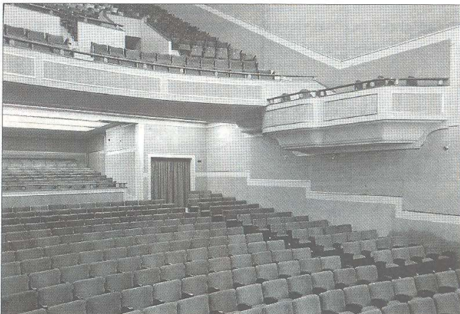
Imatge de l'interior de l'antic cinema Fèmina de Tortosa, tancat l'any 1998.

panya del film Lo que nunca muerde del director Julio Salvador i l'actor Canalejo San Martín.