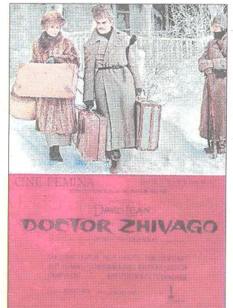
Cartell del clàssic del cinema 'Doctor Zhivago'.