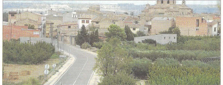
Ginestar es la localidad de menos de 1.000 habitantes que más población ha perdido.

■ La Ribera d'Ebre y la Terra Alta intentan luchar contra la despoblación con programas de emprendimiento o con medidas como el programa 'Retorna', una plataforma digital que intenta facilitar la inserción laboral de los jóvenes en las zonas rurales.