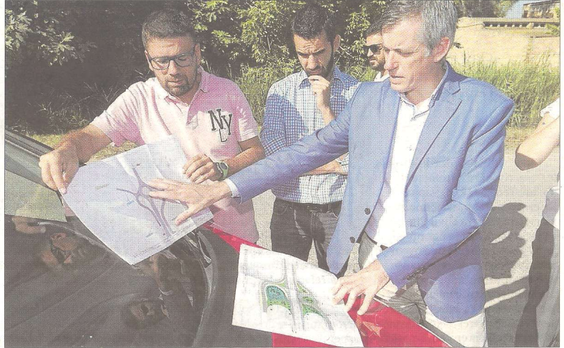
L'alcaldé i regidors mostren els projectes previstos pel Ministeri de Foment.

La millora dels accessos de l'N-340 comporta la construcció, per la seva banda, d'una altra rotonda per regular el trànsit a la car-