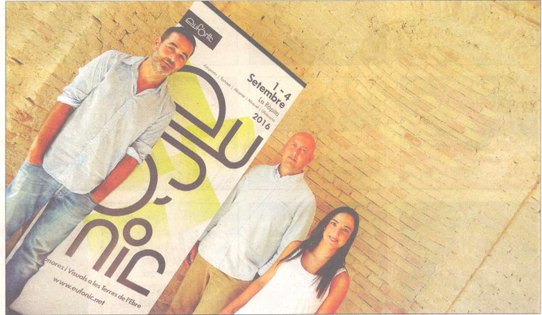
El director del festival, l'alcalde de la Ràpita i la regidora de Cultura.

Campus Eufònic 2016 presentarà, per primera vegada, la jornada #supportvisualists, creada per visualistes