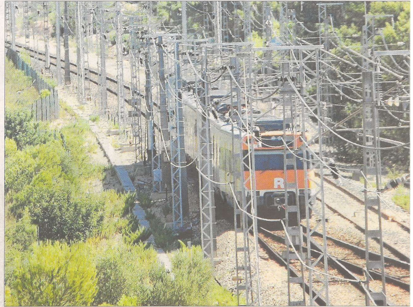
Imagen del convoy averiado por la caída del cable de la catenaria, en la bifurcación de Calafat.