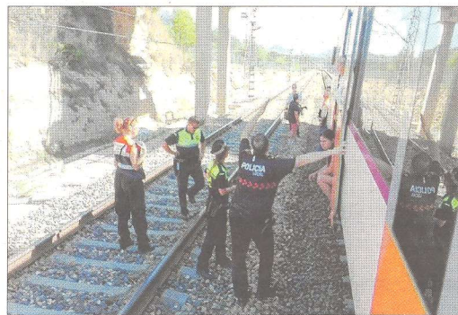
Efectivos de policía y emergencias acudieron al tren después de que los pasajeros llamaran al 112.

«Nos sentimos maltratados y abandonados, tanto por parte de los culpables primeros de esta situación -Renfe y Adif- como por parte de sus cómplices, el Departamento de Territorio i Sostenibilitat, que incorporando los retrasos a los horarios lo que hace es legitimar la nefasta gestión de las infraestructuras por parte del Estado». Asu entender, «ya no se trata sólo de la pérdida de tiempo y de los retrasos inasumibles, sino también de falta de seguridad».