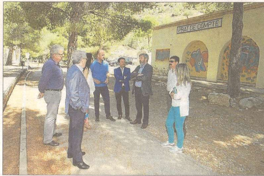
Les autoritats col·laboradores van visitar ahir els espais.

i 91.235 euros a la millora i senyalització turística de les platges de l'Ametlla de Mar.