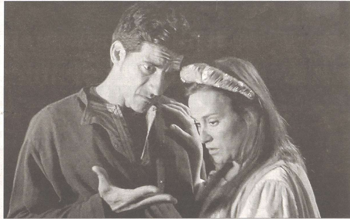
Una de les escenes del curtmetratge, concebut com a pilot d'un futur llargmetratge.

En el camí, la jove es trobarà amb una esposa entregada però amb un secret, una viuda a qui la idea d'un setge a terra profunda-