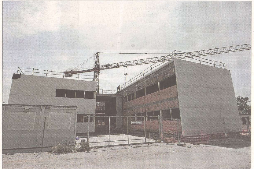
Estat de les obres al nou Centre d'Atenció Primària de Roquetes.