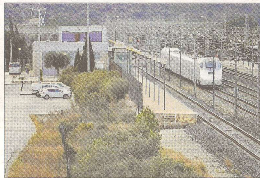
L'estació de l'Aldea, actualment.

gants que posem sobre la taula», avança Royo.