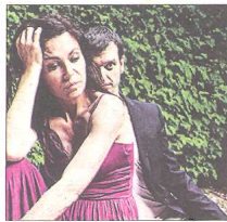
'EL VERGER DE L'AMAT' Literatura de Ramon Llull

Un recull dels principals trets de la biografia llull·liana, combinats amb una tria de faules escollides del Llibre de les bèsties i una selecció acurada d'idees-força, extretes de la novel·la Raimon o el seny fantàstic , de Lluís Racionero. Divendres, dia 27 de maig, a les 19 h. Carpa de la fira.