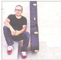
'ESTELLÉS INFINIT' Literatura de Vicent A. Estellés

El timbre dels instruments de Ferran Pissà i la qualitat com a rapsoda de Montse German ens transmetran la bellesa dels versos més místics de Ramon Llull, que volen donar resposta a una pregunta: què és l'amor? Dissabte, dia 28 de maig, a les 18.30 h. Casa Montagut.