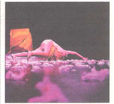
'OMBRA I SILENCI' Textos de M. Mercè Marçal