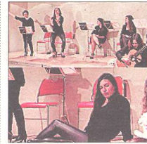
'COS' Textos d'Estellés, Bonet i altres

Recreació del mite de la Cucufera a partir d'elements del patrimoni ebrenç com el joc de la morra de la Ràpita, el toc del corn dels llagutgers de Móra d'Ebre i la cursa del cresol de Prat de Comte amb textos de clàssics com Jesús Moncada o Artur Bladé. Divendres, dia 27 de maig, a les 22 h. Teatre la Llanterna.