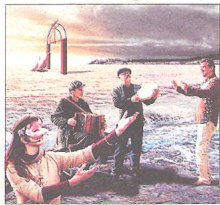
'RAMON LLULL, D'AMOR FOLL' Literatura de Ramon Llull

Un recull dels principals trets de la biografia llull·liana, combinats amb una tria de faules escollides del Llibre de les bèsties i una selecció acurada d'idees-força, extretes de la novel·la Raimon o el seny fantàstic , de Lluís Racionero. Divendres, dia 27 de maig, a les 19 h. Carpa de la fira.