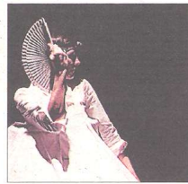
'VISITACIONS' Textos de Jesús Moncada