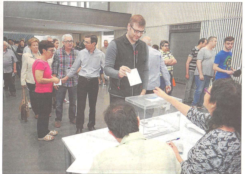
Muchos vecinos tuvieron que hacer colas de más de media hora para poder ejercer el voto.

Como ellos, muchos vecinos tuvieron que hacer colas de más