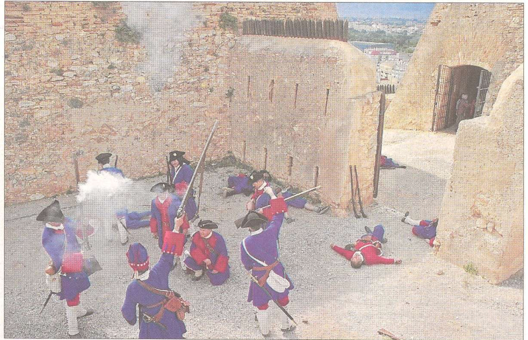
Una dels moments culminants de la jornada de recreació, a les Avançades.

Els nous responsables de l'entitat han volgut fer gir als seus objectius i han dirigit la mirada als seus associats, en el sentit d'organitzar activitats per a ells, «que fossin una part activa de l'entitat» i per incentivar, de manera paral·lela, nous afiliats. Ruiz explica que l'entitat havia perdut el