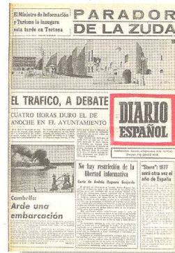
Exemplar del 'Diario Español' del 4 de setembre de 1976.

Els tràmits es van iniciar el 1970 i les obres, dos anys després. Entremig, el desembre de