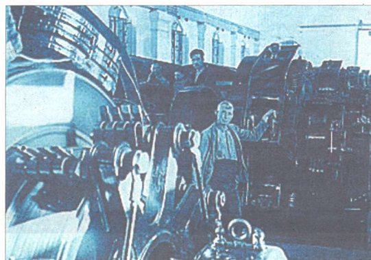
Treballadors de "la fàbrica" a principis dels anys 30.

Amb l'arribada de la Guerra Civil el 1936, "la fàbrica" va ser col·lectivitzada i molts dels tècnics alemanys van ser traslladats a Itàlia. "Va ser una de les primeres indústries catalanes controlades per la Comissió d'Indús-