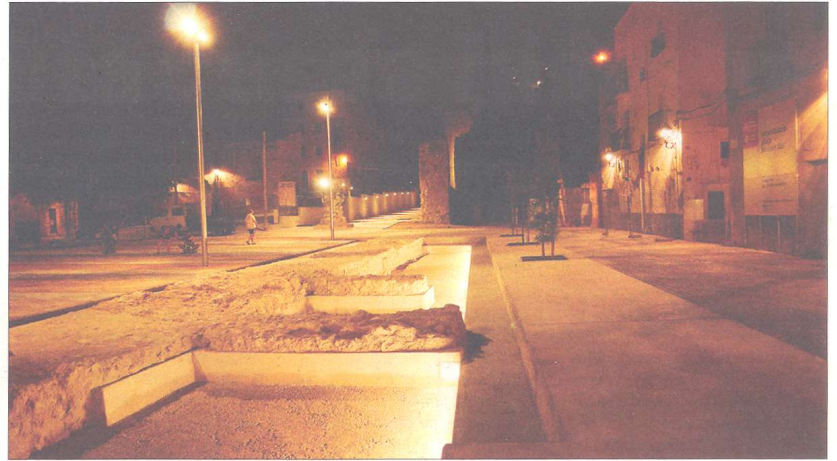
La plaça de Mossèn Sol ofereix una vista particular a les nits amb la nova il·luminació led que s'ha instal·lat.