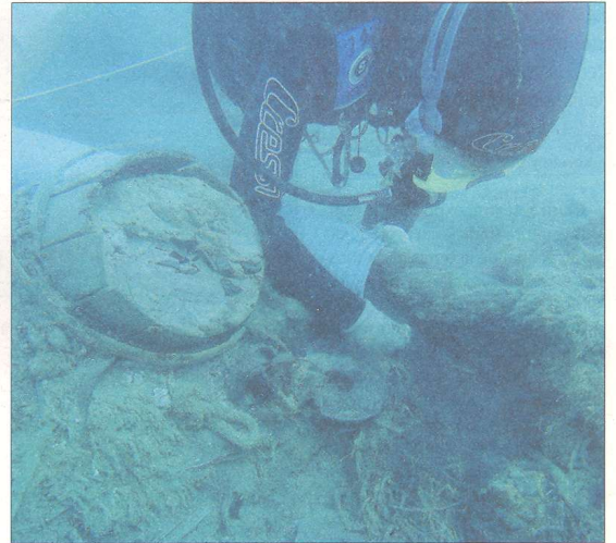
Imatges de les excavacions dutes a terme aquest estiu al 'Deltebre I'.