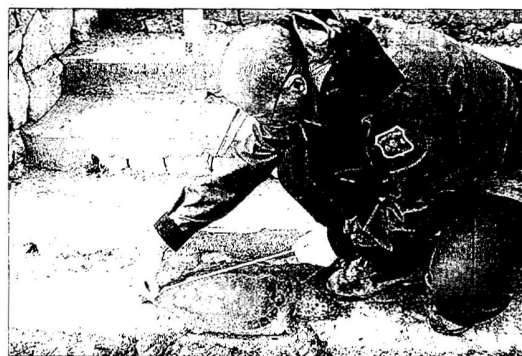
Un membre dels Agents Rurals mesura les dimensions d'una tortuga babaua apareguda a l'Ebre.