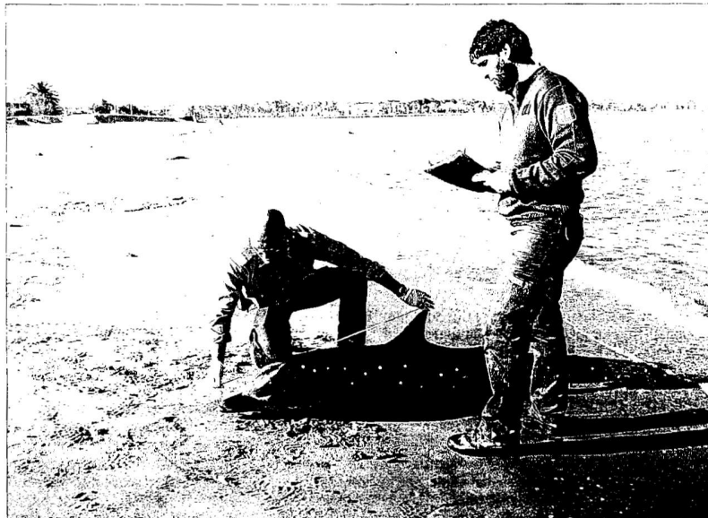
Un exemplar de dofí llistat a les platges de les Terres de l'Ebre.

Al llarg de 2015, explica Gutiérrez al Diari , tècnics dels departaments de Territori i Agricultura van organitzar diverses xerrades divulgatives a les confraries