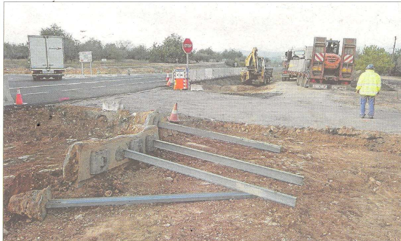
Obres de construcció de la nova rotonda de la N-340 al Perelló.

Així, expliquen, les rotondes disminueixen la velocitat mitjana de circulació a tot el tram anterior a la seva ubicació, agreujant d'aquesta manera un dels principals problemes d'aquesta carretera nacional.