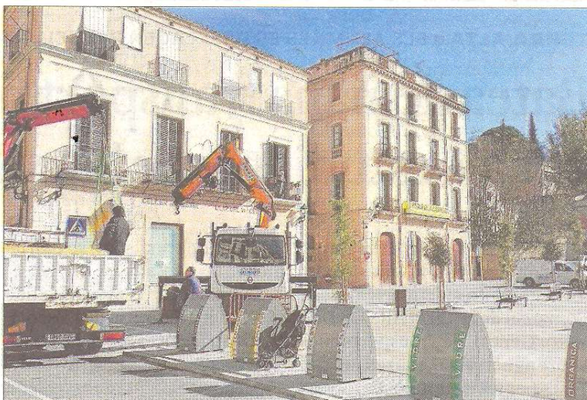
Operaris municipals retirant ahir les peces de formigó que tallaven el trànsit a la plaça.