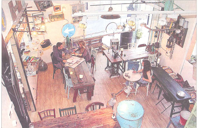
Imatge de la botiga Temps de Terra a Barcelona.

AGRICULTURA INTEGRADA El concepte de proximitat és bàsic per al projecte, ja que consideren que la bondat d'un producte està associada, ans que res, al coneixement que es té del lloc on s'ha fet. I ho apliquen a un model agrícola i de producció autosuficient. A Temps de Terra abracen la idea "d'una agricultura i una ramaderia integrades al lloc", on els animals campen al seu aire en un indret harmònic i extens, sense obstacles, i allunyats de pràctiques menys respectuoses amb el cicle natural dels animals. A Temps de Terra, la terra nodreix les plantes, les plantes alimenten els animals, els animals abonon la terra i la terra nodreix les plantes en un cicle natural en què l'espectacular paratge de la vall de Cabiscol es fa present, també, a la capital del país. "La gent que va a comprar a la botiga de Barcelona és com si anés a comprar a Temps de Terra, hem intentat traslladar una part de la finca allà" a través de l'ambientació i el producte que s'hi consumeix. "El nostre client ha vist a la finca els animals, el que mengen, i quan compren la carni saben perfectament d'on prové", recorda Francesc. Al final de tot plegat, l'acte de compra en aquest tipus de projectes que van més lluny de fer de simples intermediaris o distribuïdors de productes aliens, es converteix en una experiència en què es pretén que els compradors formen part d'una realitat pròpia i palpable. ■