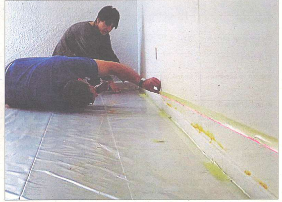
L'exposició és un treball en equip que dona fruit a una exposició col·lectiva amb diferents espais i micro exposicions.