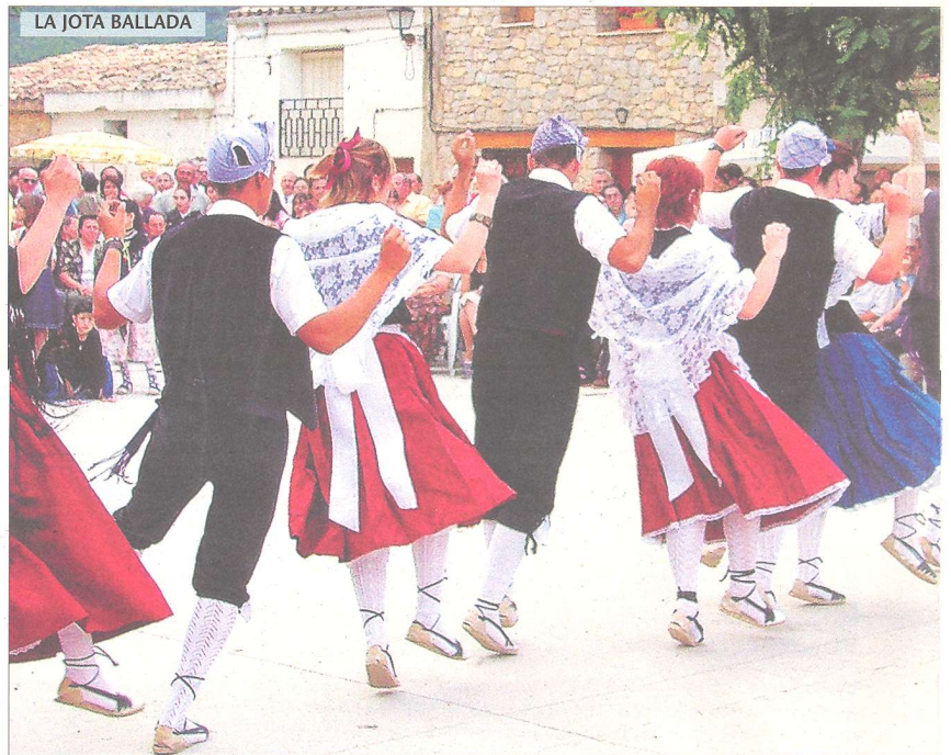
LA JOTA BALLADA