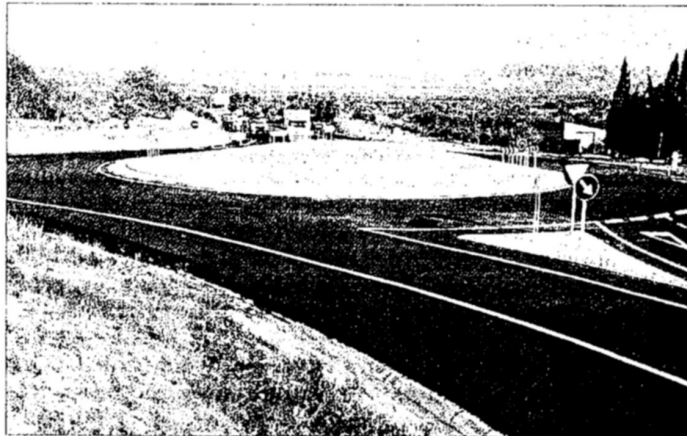
La rotonda ja acabada del Perelló.

de del municipi, Jordi Gaseni, mentre que la prevista a l'alçada de Sant Jordi pot servir per evitar nous accidents, la que s'ha començat a construir ara «no té cap sentit». «Està pensada per desbarbar... per fer el trànsit més lent i que els conductors es cansin i