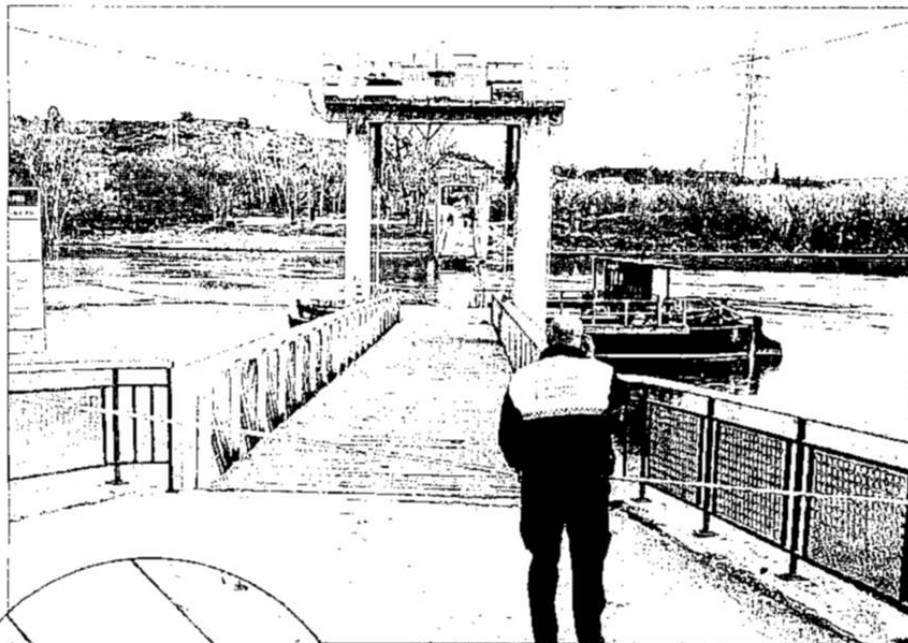
Els Mossos van establir un perímetre de seguretat, diumenge.

Amb tot, alguns usuaris que es trobaven al marge esquerre del riu es van veure afectats per la interrupció del servei, havent d'efectuar la tornada fent la volta al meandre.