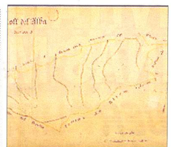
AMIRALLAMENTS DE TORTOSA DEL 1868

S'han digitalitzat les fitxes descriptives dels refugis existents el 1944, construïts per la Junta de Defensa Passiva republicana, amb indicació de localització, cabuda, mides, materials, equipaments, etc. També hi ha diversos plànols d'ubicació i documentació diversa de la Junta de Seguretat sobre la xarxa de refugis de la ciutat de Tortosa.