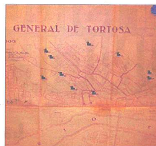
FITXERS DELS REFUGIS ANTIAERIS DE LA CIUTAT

Entre els documents inèdits que surten a la llum en el repositori digital hi ha el projecte de monument als vencedors de la Batalla de l'Ebre, datat del 1938, de l'arquitecte municipal Agustí Barlett. Es tracta d'un dibuix a llapis i ploma del projecte del monument. A més a més, també es recull un arxiu fotogràfic de Josep Dauff sobre el procés de construcció del monument.