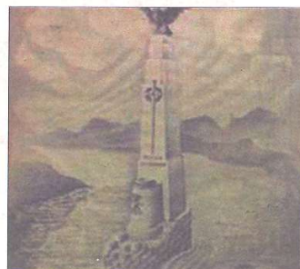
PROJECTE DE CONSTRUCCió DEL MONUMENT A LA BATALLA DE L'EBRE

Entre els documents destacats del repositori digital hi ha el plànol del 1941 elaborat per Regiones Devastadas, que mostra el detall del nivell d'afectació dels edificis de Tortosa a causa de la Guerra Civil. També es pot consultar el plànol de la reconstrucció de la ciutat presentat per l'arquitecte Barlett per tal de construir un nou barri a Ferreries.