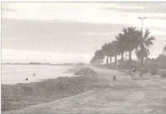
Aquest temporal ha tornat a deixar pràcticament sense sorra la platja de l'Arenal de l'Ampolla.

Més enllà de les reparacions puntuals, fa anys que es reclamen solucions a la regressió, en aquest punt i en d'altres del delta de l'Ebre. «S'han invertit molts milions d'euros en filtres verds o indicadors ambientals i no en combatre de forma efectiva la regressió del litoral. Si ens quedem