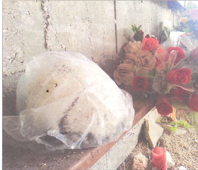
El crani dipositat al Memorial de la Fatarella. / A. PRUNERA

A més a més, Sambró també critica la gestió que es duu a terme de l'ossera del Memorial de les Camposines i destaca que "no se sap quin tractament es fa als ossos que hi apareixen, probablement cap" i acaben emmagatzemats dins l'espai de l'ossera de les Camposines. És una idea que també subs-