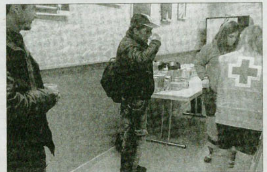
Uno de los indigentes, en el interior del albergue.

Por segundo día, efectivos de la Guardia Urbana, Creu Roja y Protecció Civil peinaron el jueves por la noche las calles de