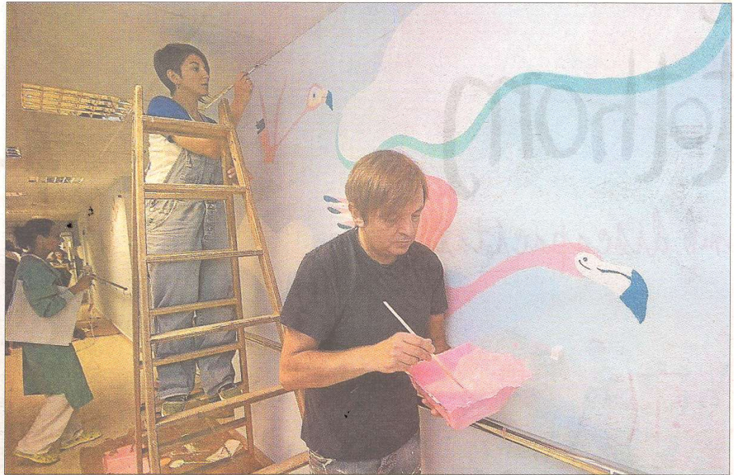
Els treballs avancen a bon ritme i estaran finalitzats el divendres.

«Estem avançant a molt bon ritme i tot el personal de l'hospital està molt content de com estem fent la faena. Volem acabar aviat perquè no podem interrompre cap servei mèdic», detalla.