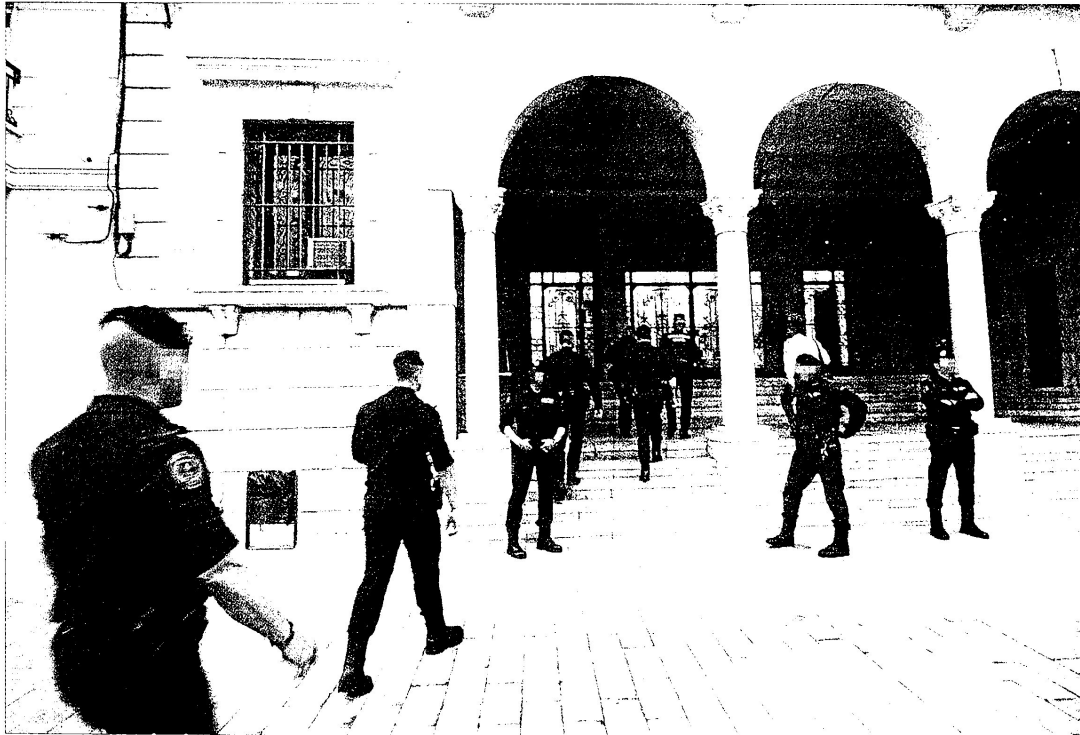
Operativo policial ayer por la noche frente al ayuntamiento de Amposta.

CASO INNOVA | OPERACIÓ EN LES TERRES DE L'EBRE