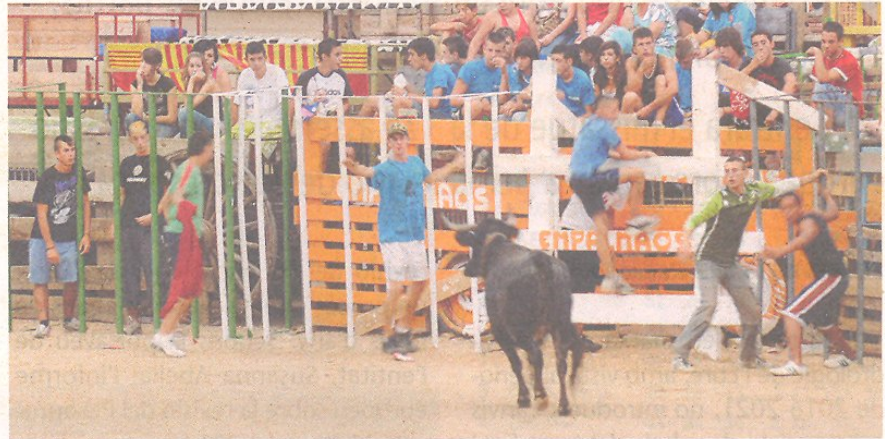
Imatge d'un correbou a Amposta.

Una demostració de força sense precedents és el que busquen les penyes taurines i ramaderies del terrotir amb la manifestació d'aquest diumenge, dia 19 d'abril, a Amposta. "Mai abans s'haurà mobilitzat tanta gent de tot el territori català per defensar una mateixa festa" , auguren els convocants. Sota el lema Respecte i llibertat per la nostra festa, cultura i tradició. Sí als bous , la marxa discorrerà, a partir de les 11 del matí, entre el pavelló firal i la plaça de l'Ajuntament, on es llegirà un manifest que, segons les penyes, d'una banda exigirà respostes concretes i de l'altra farà una reivindicació general "de la festa dels bous i la llibertat"; solucions concretes sobretot a les principals problemàtiques que recentment han posat damunt de la taula els defensors dels bous: la no resolució de l'expedient de la declaració dels correbous com a festa patrimonial catalana, l'alegalitat de la modalitat dels bous a la mar, les taxes "abusives" dels veterinaris per als correbous i, el que ha exercit de detonant de la manifestació, la il·legalitat que continua planant sobre les proves de bravura amb públic, la regularització de les quals va ser rebutjada el mes passat al Parlament.