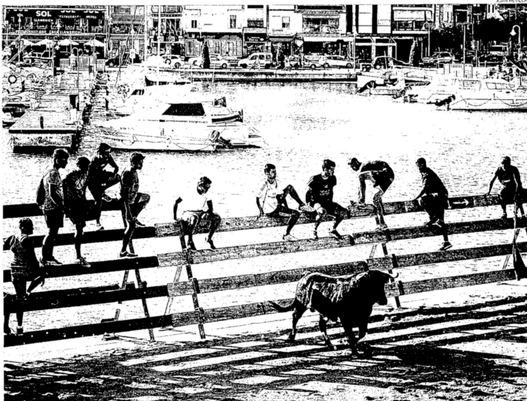
► Un toro es passeja per la plaça situada a la platja de l'Ampolla davant la mirada de joves assistents.