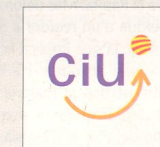
Vicent Labèrnia (CiU)