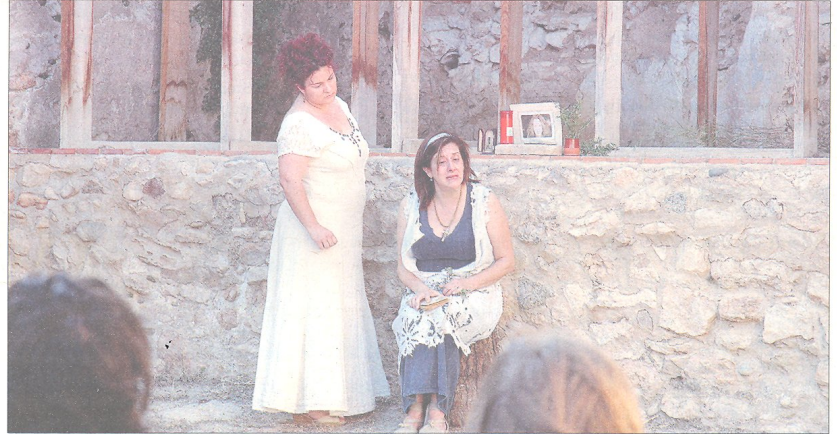
Imatge de l'espectacle teatral 'Vestigis', que es podrà veure a Litterarum.