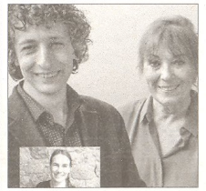
'EL POETA OVIDI' Versos d'Ovidi Montllor