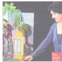
'PEL CAMÍ DE LA PARAULA' Versos de Miquel Martí i Pol

La companyia Mea Culpa ha fet una adaptació per al teatre dels contes d' El cafè de la Granota de Jesús Moncada i relata l'últim dia en aquest cafè de Mequinensa abans de la desaparició del poble vell sota les aigües del pantans de Mequinensa i Ribarroja. Divendres, dia 5 de juny, a les 22.30 h. Teatre La Llanterna.