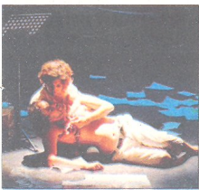
'PHANTASTICUS' Literatura de Ramon Llull

Produccions del Mar presenta una obra de teatre sobre el darrer viatge de tornada a Mallorca de l'escriptor Ramon Llull. L'obra reviu alguns dels episodis més coneguts de la seua vida i Llull es retrobarà amb personatges que l'han acompanyat en la seua vida. Divendres, dia 5 de juny, a les 13.15 h. Teatre La Llanterna.