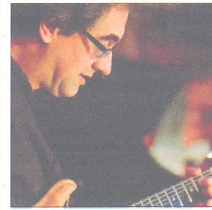
'ELS FRUITS SABOROSOS' Versos de Josep Carner

Produït per Marduix, aquest espectacle de titelles està basat en poemes de Miquel Martí i Pol i és un recorregut per la vida del poeta a través de les seues emocions i vivències. És un muntatge fet amb imatges, figures, música i les paraules que ens porten pel seu camí. Dissabte, dia 6 de juny, a les 10.30 h. Biblioteca comarcal.