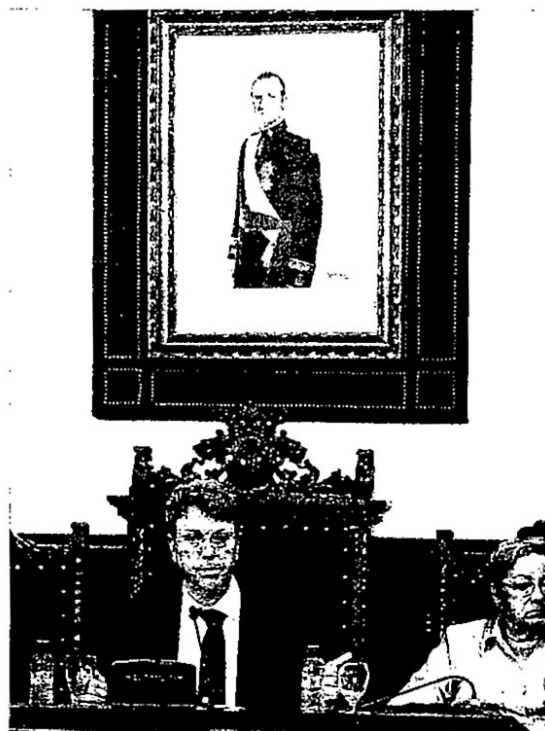
Imagen de uno de los plenos celebrados en este mandato en el Ayuntamiento de Tortosa.

Movem Tortosa, agrupación de partidos encabezada por ICV, aspira a liderar el voto que pide un cambio de personas y políticas en el ayuntamiento. Una campaña intensa, en la calle y redes sociales, y la suma de representantes de la sociedad civil le pueden ayudar en ese propósito.