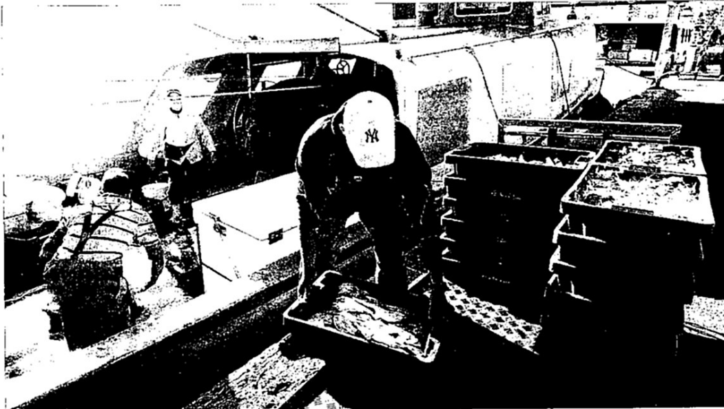
Pescadors descarregant peix, ahir, després de la jornada de feina.