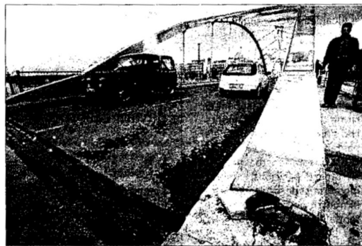
Aspecte actual del pont de l'Estat sobre el riu Ebre a Tortosa, amb un visible estat de degradació.

banda. Així, el pas de vianants i carril bici al marge esquerre del pont arribaran pràcticament a peu pla al carrer Víctor Gimeno oferint un accés més agradable que l'actual per als vianants.