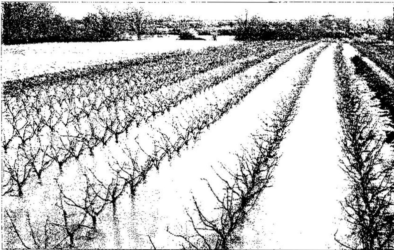
Imatge d'un dels camps inundats per la crecuda de l'Ebre.