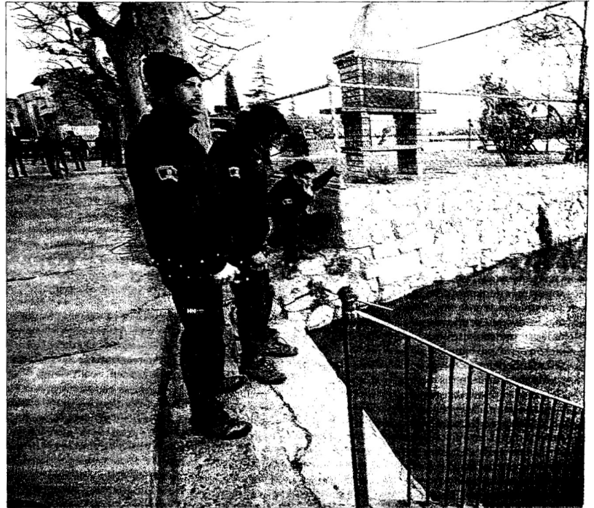
Efectius dels Bombers vigilants el nivell del riu Ebre, ahir a Miravet.

Per la seva banda, el Consorci d'Aigües de Tarragona informà que no hi ha cap incidència en el subministrament d'aigua de boca a les poblacions de la zona. A més, el subministrament està garantit durant tres dies encara que