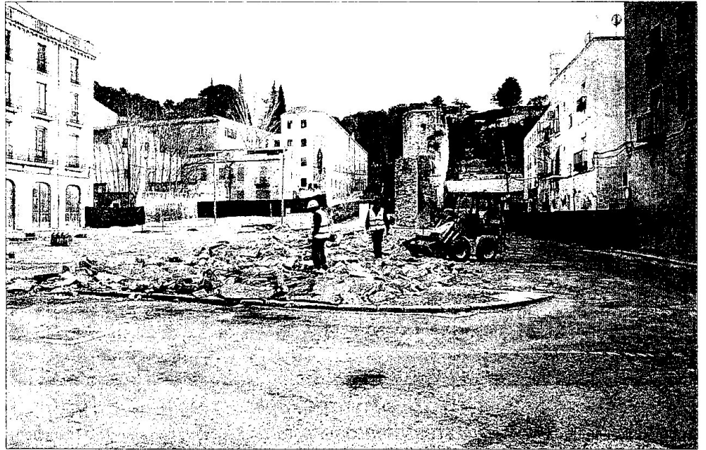
Imatge de l'inici dels treballs d'urbanització de la plaça Mossèn Sol.

La pavimentació de tot l'entorn es farà mitjançant llosetes de pedra artificial a la zona de l'àmbit de la muralla, i de formigó prefabricat en diferents colors per