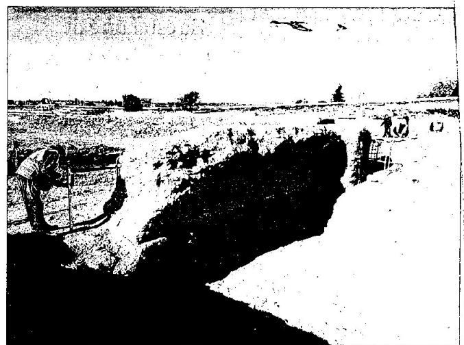
Les actuacions han posat al descobert una antiga cisterna o aljub de l'assentament medieval vora la torre.

Precisament el projecte de l'àrea de lleure, que s'està executant, preveu treure a la llum tot l'esplendor de la torre i el seu vol-