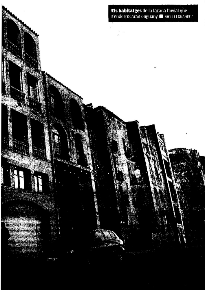
Els habitatges de la façana fluvial que s'enderrocaran enguany ■ JORDI FERRANDEZ

El jutge d'instrucció ha decretat presó provisional comunicada i sense fiança per a dos detinguts més en l'operació policial contra el frau fiscal a Tarragona. En total ja són quatre els empresonats per formar part d'una xarxa il·legal de venda de cotxes de luxe. A tots ells se'ls imputen delictes de blanqueig de capitals, pertinença a grup organitzat i defraudació d'hisenda pública. A més, a un d'ells també se l'acusa d'amenaces, i a un altre, d'extorsió, amenaces i tinença d'armes. ■ ACN