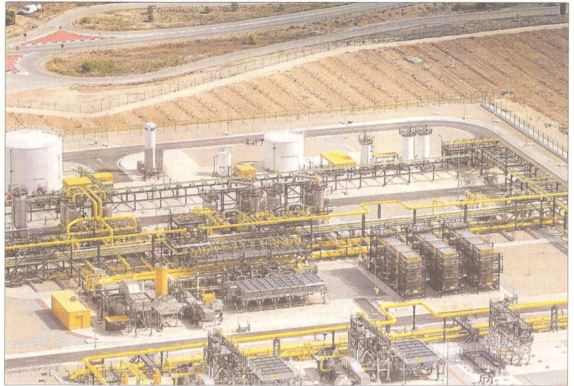
Panoràmica des de l'aire de la planta terrestre del projecte Castor.

El jutge, que no reconeix la planta dins de la xarxa bàsica de transport de gas natural –que l'hauria eximit de llicència municipal–, recorda que una activitat industrial en terrenys rústics exigia a l'empresa obtenir la Declaració d'Interès Comunitari per part de la Generalitat Valen-