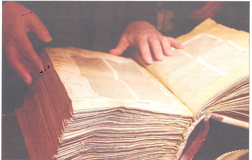
Un incunable del 1483 amb textos bíblics que va ser restaurat abans de la Guerra Civil espanyola i que està al fons de l'Arxiu Capítular de la catedral de Tortosa.

L'Arxiu Capítular ara ha iniciat la restauració dels pergamins; un treball molt costós, però, segons detalla mossèn Alanyà, molt necessari per poder fer "una lectura del seu contingut" perquè amb el pas del temps han sofert molt deteriorament. Ara s'ha iniciat la seua neteja i planxat, coincidint, a més a més, amb l'elaboració del tercer volum del Diplomatari de la catedral, sota direcció d'Antoni Virgili. Concretament, aquest volum estarà dedicat a l'època de la reconquesta de València, en temps de Jaume I. De tots els pergamins, els més importants són els que van del segle xii al xiv, tot i que els més abundants són els anomenats censals, que era com l'escriptura que es feia entre l'Església i la gent que donava diners per