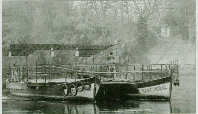
Imatge de l'embarcació fluvial que actualment està en funcionament al municipi de Miravet.

A banda de ser el responsable del funcionament de la barca, Vicent Benaiges també n'és l'encarregat del manteniment