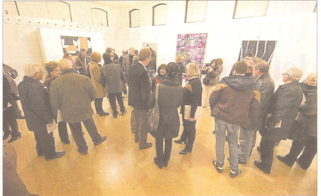
Inauguració de l'exposició de les obres guanyadora i finalistes del premi.

L'Ajuntament, a través del Museu de Tortosa, Històric i Arqueològic de les Terres de l'Ebre, ha reprès enguany i amb caràcter biennal el Premi de Pintura Francesc Gimeno, hereu de la Meda-