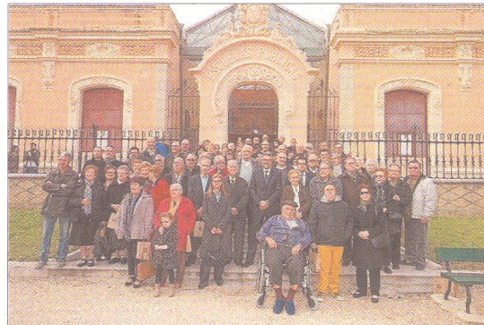
Antics camàlics i familiars, en acabar l'acte d'homenatge organitzat per l'Ajuntament.