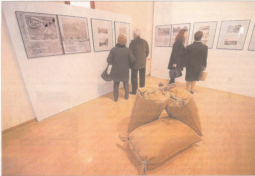
L'exposició es pot visitar fins al 25 de gener al Museu de les Terres de l'Ebre.

Les dues entitats tenien les seves pròpies colles de camàlics, formades per un nombrós grup