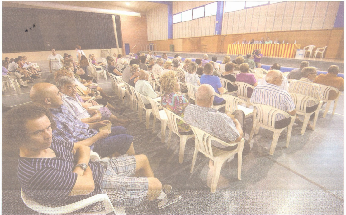
Més de 150 socis de la Cooperativa Agrícola de l'Aldea van assistir ahir a la nit a una nova assemblea general.

Amb els comptes aprovats, els socis van donar un nou vot de confiança a l'actual direcció i van rebutjar l'opció del tancament i liquidació de l'entitat, defensada cada cop més obertament pels dos grups de socis afectats per la fallida de la secció de crèdit de la cooperativa a finals de 2011. Una fallida que ha provocat el bloqueig de 4,6 M€ dels socis.