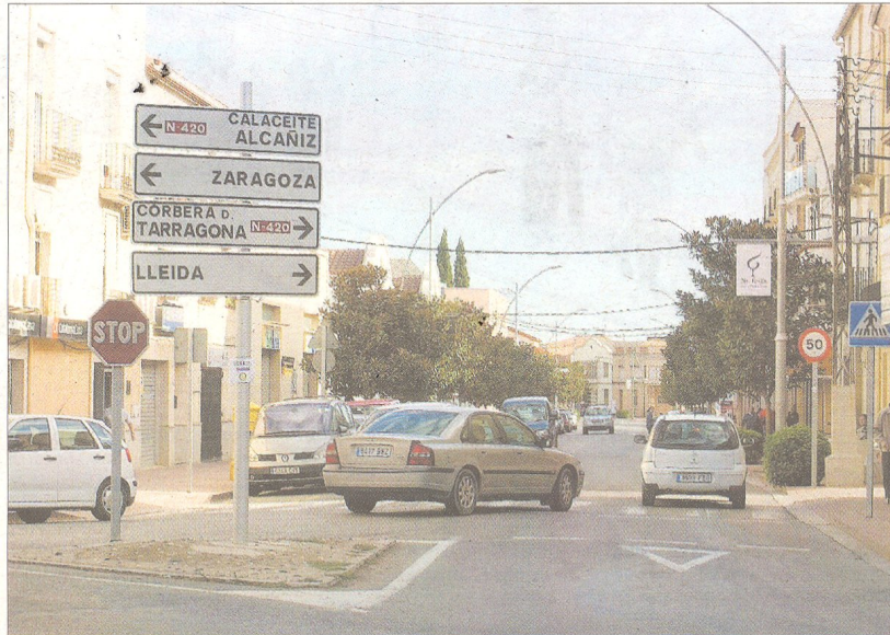
El pas de camions a la plaça de la Farola de Gandesa, una cruïlla de carreteres, provoca col·lapses.

El passat mes de juny, la delegació del Govern de la Generalitat a l'Ebre va reunir els alcaldes afectats per l'A-7 en una reunió per visualitzar un front comú institucional a favor de l'autovia. Una trobada on es va pactar entrar una moció al Parlament exigint l'execució immediata de les obres i que durant els treballs l'autopista AP-7 fos gratuïta.