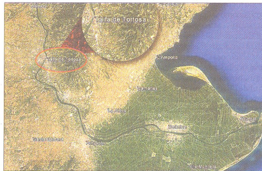
Imatge de l'aplicació Google Earth amb el topònim equivocada.

minació de la civilització àrab a la ciutat que, cal recordar-ho, es va perllongar durant més de 400 anys, de 715 a 1148.